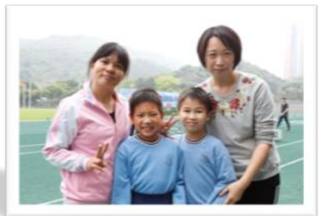
家長們也參加比賽