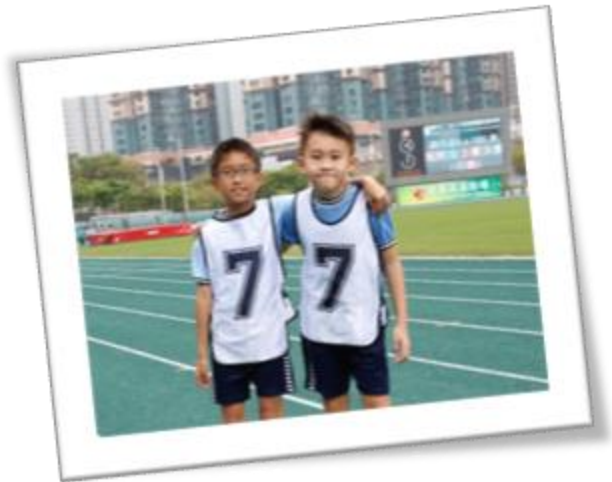
友誼第一 比賽第二