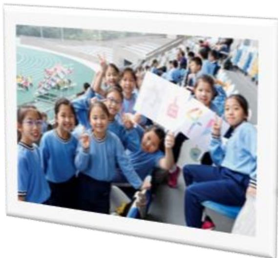
啦啦隊為同學打氣，加油！努力！