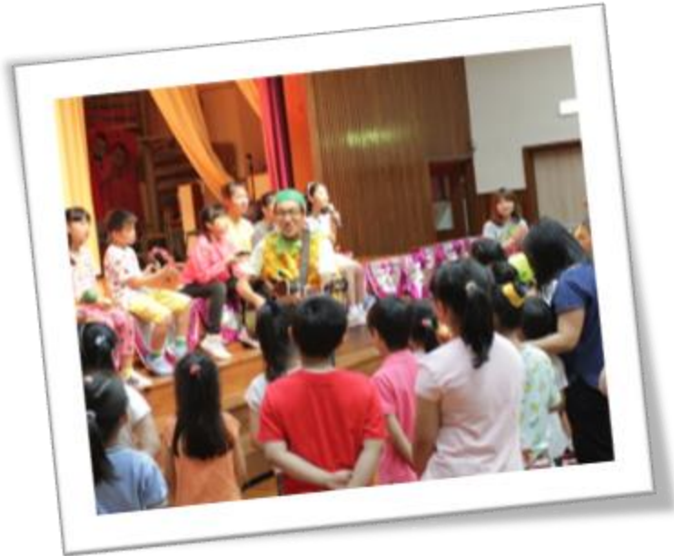
與麥 sir 合唱水果日主題曲

為了在校園及社區營造學生每天吃水果的環境和氣氛，並提升他們對水果營養價值之認識，學校於5月22日至6月2日定為「水果雙週」，於5月23日與家長合作在校推行「水果日」。「水果日」當天，學生穿了與水果有關的衣服回校，在小息時參與攤位遊戲和家長義工安排的水果試食，並在禮堂與老師一起高唱水果日主題曲。當天各人皆投入參與，令整所學校充滿濃厚的愉快氣氛。