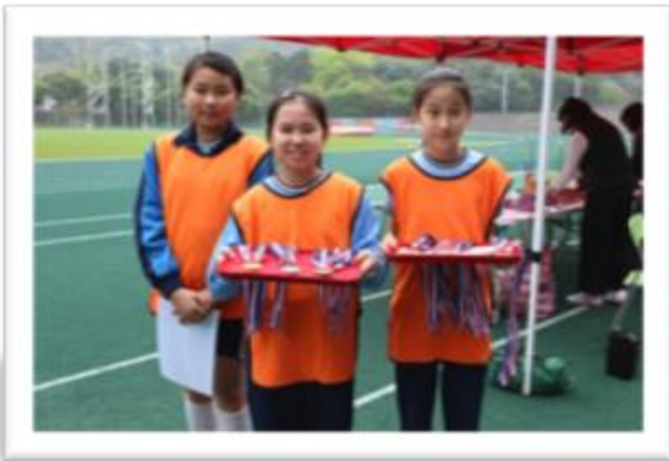
精神抖擻的服務生