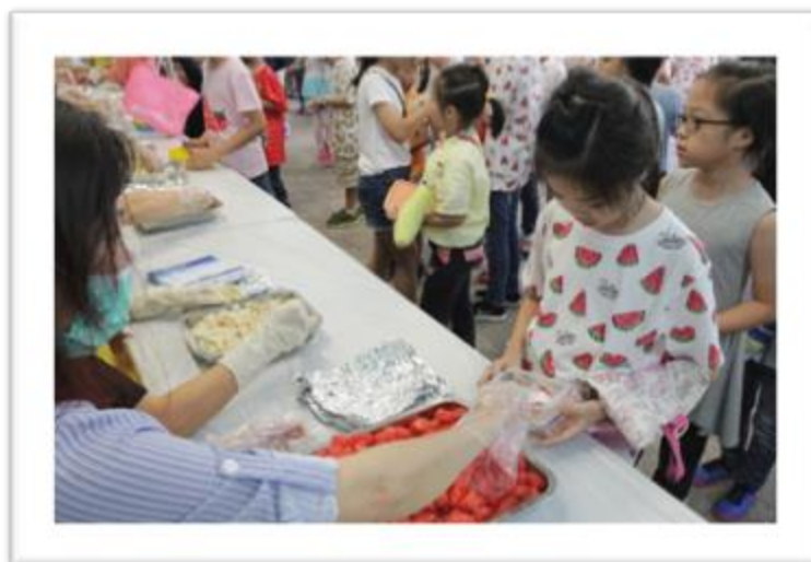
試食不同款式的水果