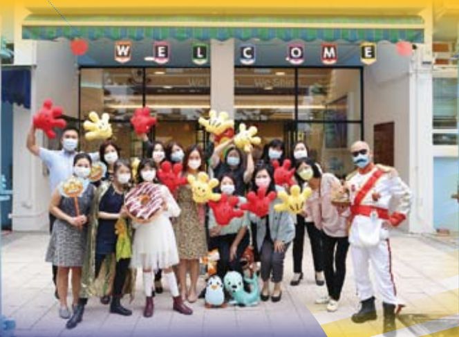
各位老師來一張大合照。