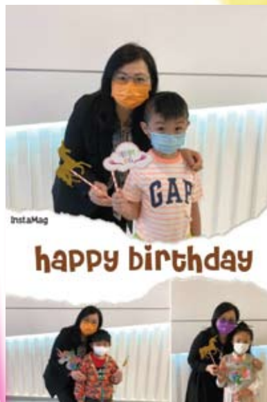
生日之星與校長合照