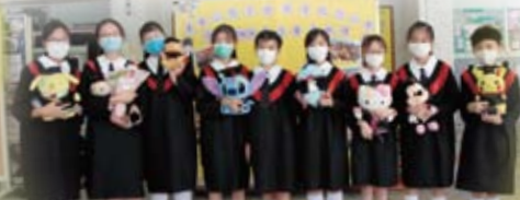
同學們手捧畢業公仔，開心地大合照！