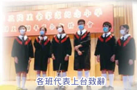
各班代表上台致辭