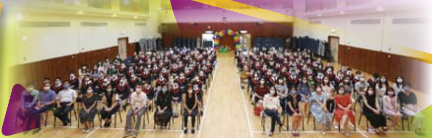
全禮畢業生與校長及老師大合照