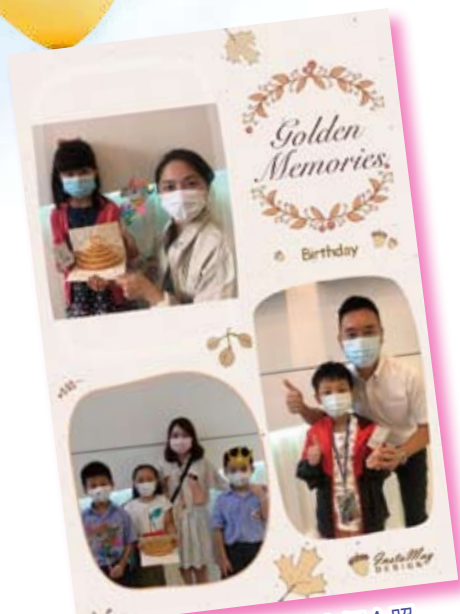
生日之星與心儀老師合照

今年的生日之星，你們有沒有在學校裏感受到滿滿的愛呢？學校為了讓每一位生日之星能夠留下美好的童年回憶，所以邀請每一位生日的同學，在生日當天主動邀請好朋友或老師一起在大堂拍下一張難忘的生日照，他們還可以挑選喜歡的道具呢！此外，班主任還利用週會時間與各班同學共慶生日，一起拍照、吃東西及玩遊戲，好不快樂！各位同學，生日快樂！祝你們學業進步！健康成長！