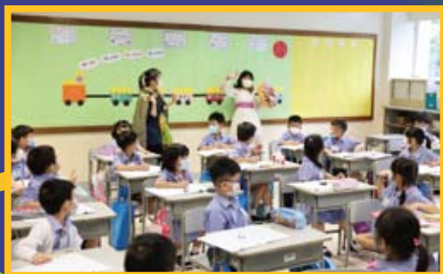
同學們很享受首天上課的日子呢！