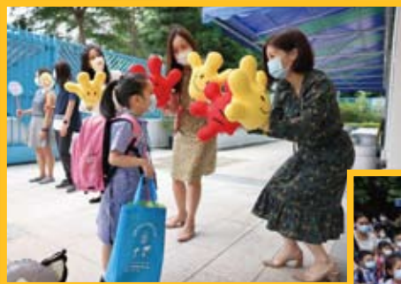
老師們在門口歡迎各位同學。