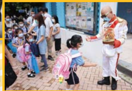
同學見到「魔法大帥哥」不禁露出開心的笑臉。