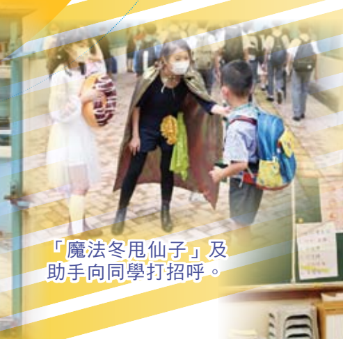
「魔法冬甩仙子」及助手向同學打招呼。