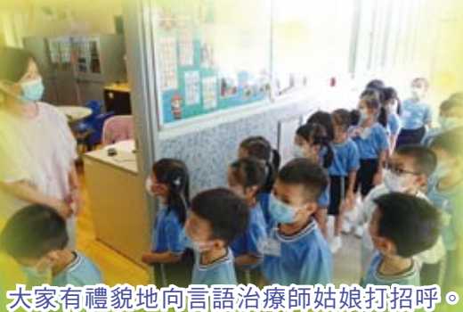
大家有禮貌地向言語治療師姑娘打招呼。