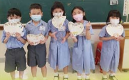
小一同學在「破冰」活動中認識了很多新同學。