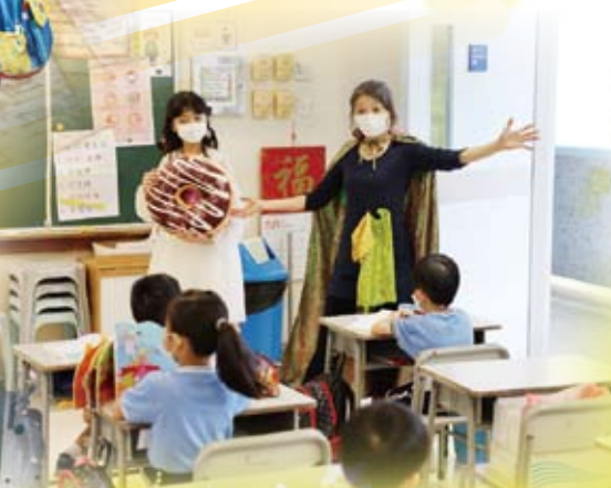
「魔法冬甩仙子」及助手進入課室為小一同學帶來驚喜！