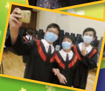
畢業生興奮地來一張Selfie