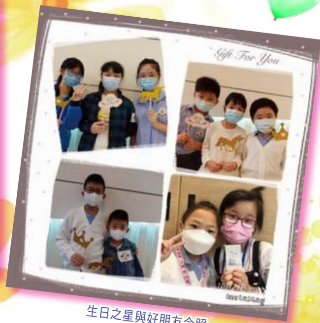
生日之星與好朋友合照