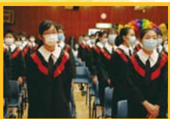
同學們的臉上都充滿着離愁別緒