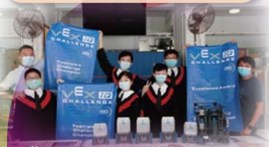
機械人校隊畢業了，希望將來可以再次揚威海外！