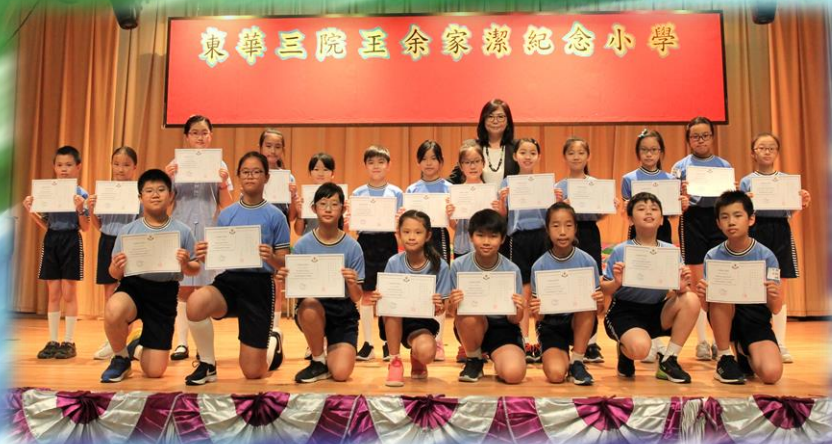
第十四屆 全港小學數學比賽 (西貢區)