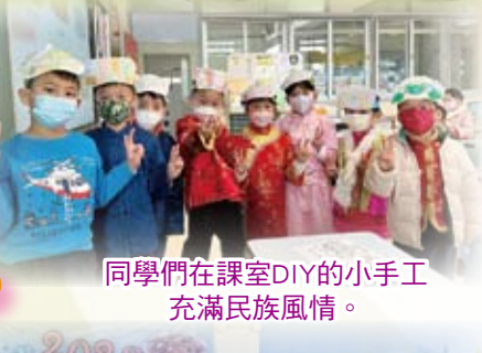
同學們在課室DIY的小手工充滿民族風情。