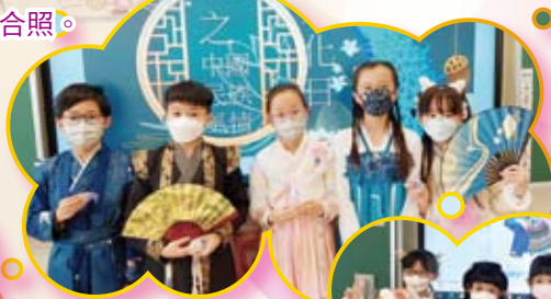
同學們穿上不同的民族服裝，為中國文化日添上濃濃的節日氣氛。