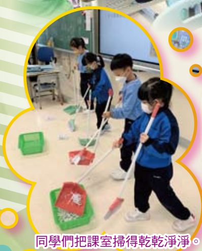
同學們把課室掃得乾乾淨淨。