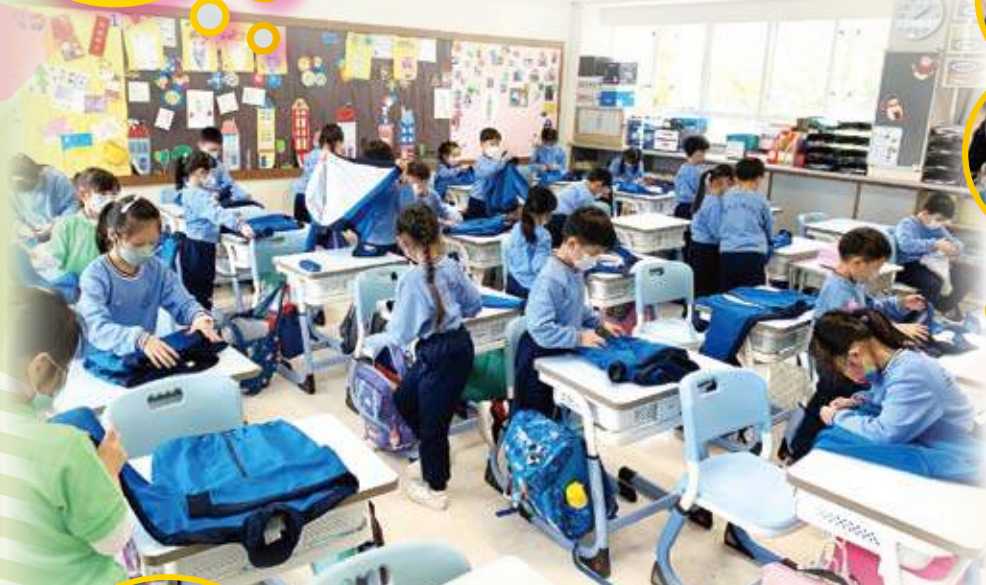
同學們齊齊學摺衣服，摺得多投入啊！