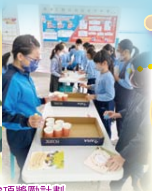
我的性格強項獎勵計劃