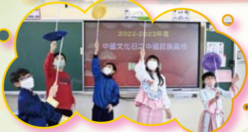
看，同學們在課室裏玩雜耍玩得多投入！