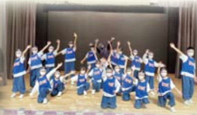
本校舞蹈隊在「第59屆學校舞蹈節」榮獲「甲級獎」。