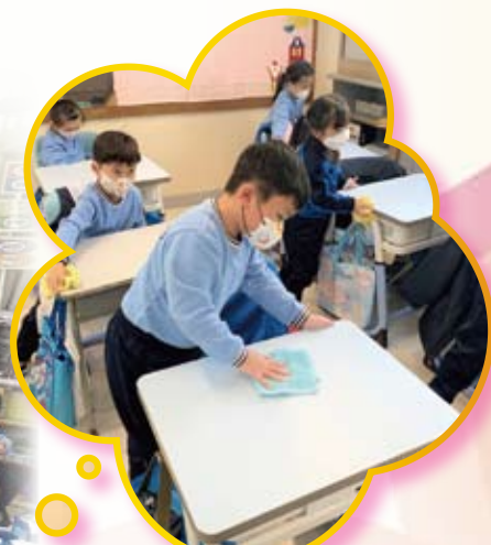
大家一起把桌子抹乾淨，體驗到做家務的辛勞。