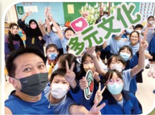
邀請少數族裔到校分享，教導學生尊重多元文化。