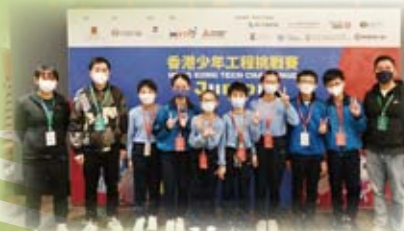
機械人隊取得「香港少年工程挑戰賽 2022」世界賽資格賽。