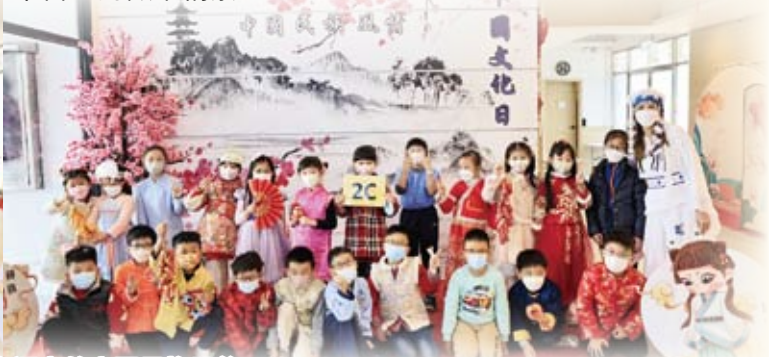
同學們和老師都穿上漂亮的中國民族服飾。