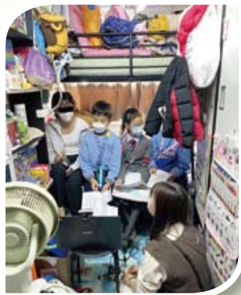
學生實地考察，了解基層家庭的生活情況。

《Power Up Programme》是一項嶄新的課程理念，旨在為孩子提供豐富而多元化的學習體驗，幫助孩子將所學的知識和技巧應用到現實生活中，提升他們的創新思維和解決問題的能力，從而培養他們應對21世紀挑戰所需的技能和知識。