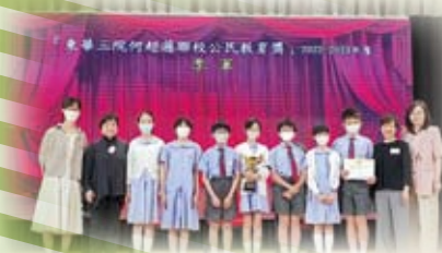
本校7名5年級學生創作的短片獲得東華三院何超瓊聯校公民教育獎季軍。