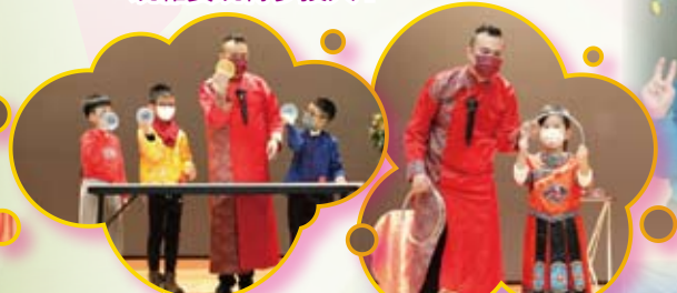
同學們在禮堂活裏觀看古彩戲法，大家有不少互動呢！