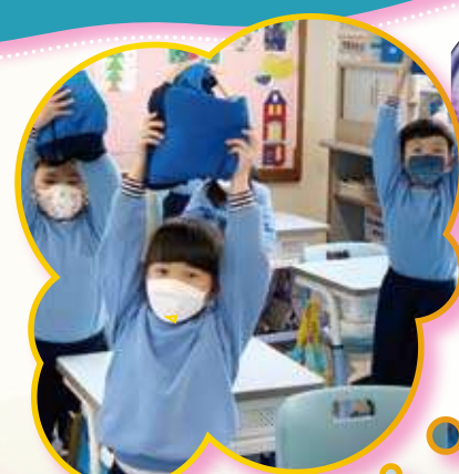
我們摺的衣服是不是很整齊呢？