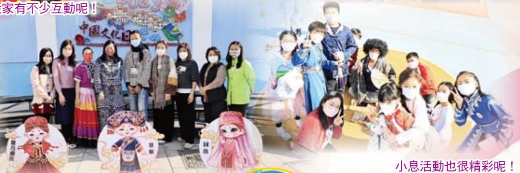
小息活動也很精彩呢！