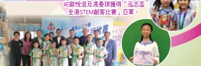
王余武武隊在東華三院小學聯校武術比賽中奪得佳績。