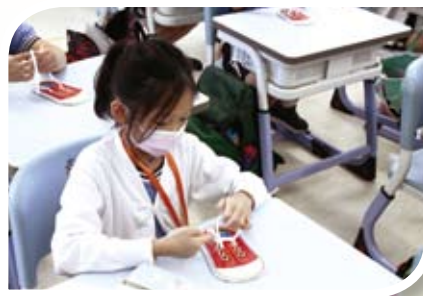
小一學生生活技能訓練。