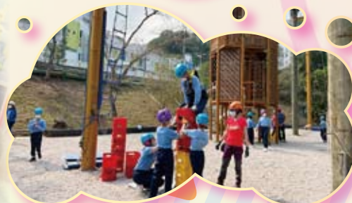
紀律領袖歷奇訓練