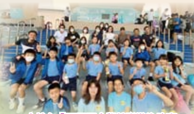
本校在「西貢區小學校際游泳比賽」獲得佳績。