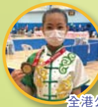
全港公開青少年兒童武術分齡賽