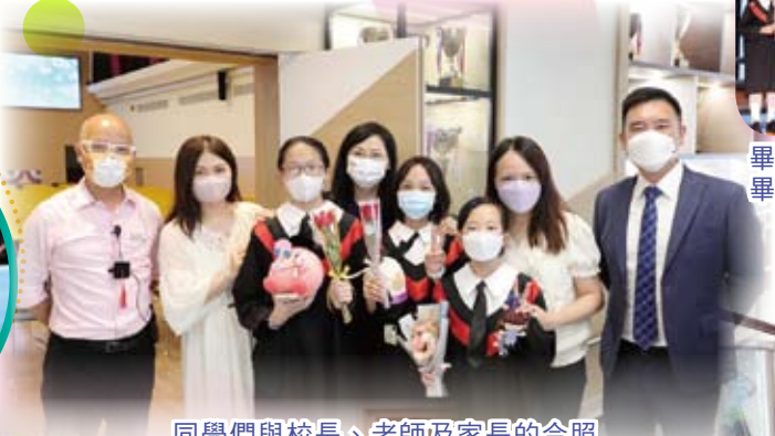
同學們與校長、老師及家長的合照