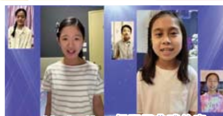
Music Show揭開了典禮的序幕，我校學生多才多藝，為大家展現自信的一面！