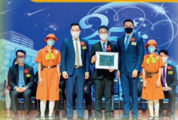
學生致送紀念品給教育局副局長施俊輝先生。

今年是我校創立25周年的大日子，校慶典禮於6月28日隆重舉行，當天出席的嘉賓濟濟一堂，除了東華三院第一副主席韋浩文先生及本校校監王賢誌先生外，更邀請到教育局局長政治助理施俊輝先生(即現任教育局副局長)擔任主禮嘉賓。25年的寒暑，讓王余家潔不論在校舍設備、課程發展、學生培育等方面都更上一層樓。學校每一點一滴的進步，都有賴曾經在這裏無私奉獻的校長和老師，感恩沿途一直有你們！在這值得慶賀的日子，感謝每一位前來道賀的嘉賓，你們的祝福和欣賞，成為推動我們繼續前行的動力！「愛與夢童行」，讓我們懷揣着愛與夢想，與孩子攜手同行，邁向更精彩的未來！