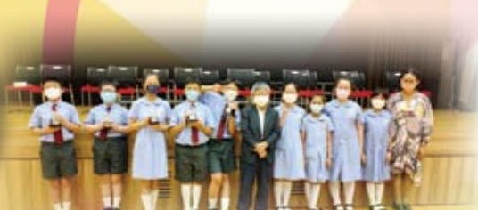
東華三院歷史問答比賽決賽，本校取得季軍。