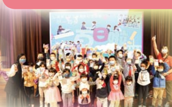
班主任和同學們玩得好投入呀！