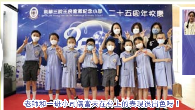
老師和一班小司儀當天在台上的表現很出色呀！