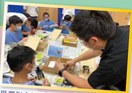
同學們耐心地聽從導師指導設計遊戲程式。