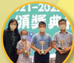
張沛松籃球邀請賽 - 禁毒杯虛擬線上投籃比賽