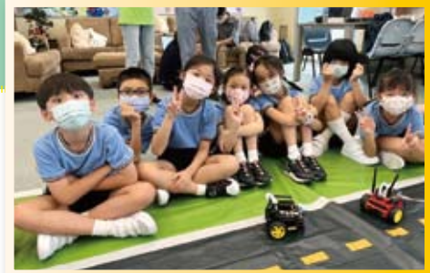
大家來一張大合照。