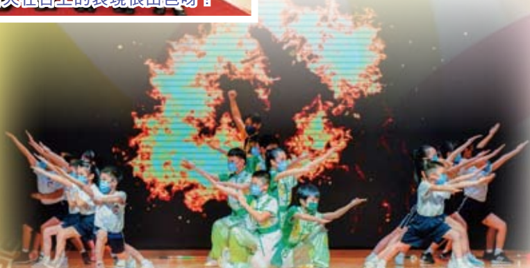
武術隊精彩的表演獲得台下熱烈的掌聲。