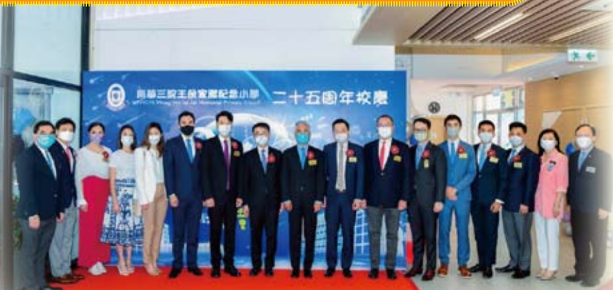
各位嘉賓來一張大合照。