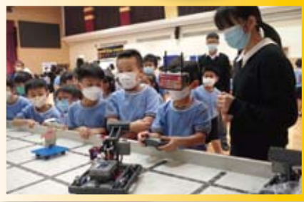
同學們興奮地試玩機械人！