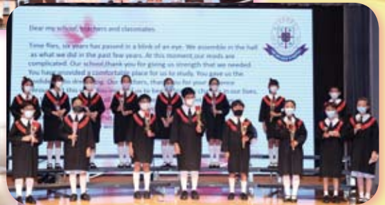
畢業生代表在台上向校長、老師及同學們訴說畢業感言，令人十分感動！