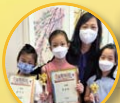
「首屆金紫荊盃全 港兒童繪畫大賽」 得獎者